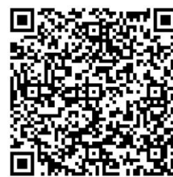
联合大学-外馆斜街校区