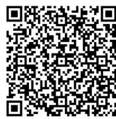
联合大学-蒲黄榆校区