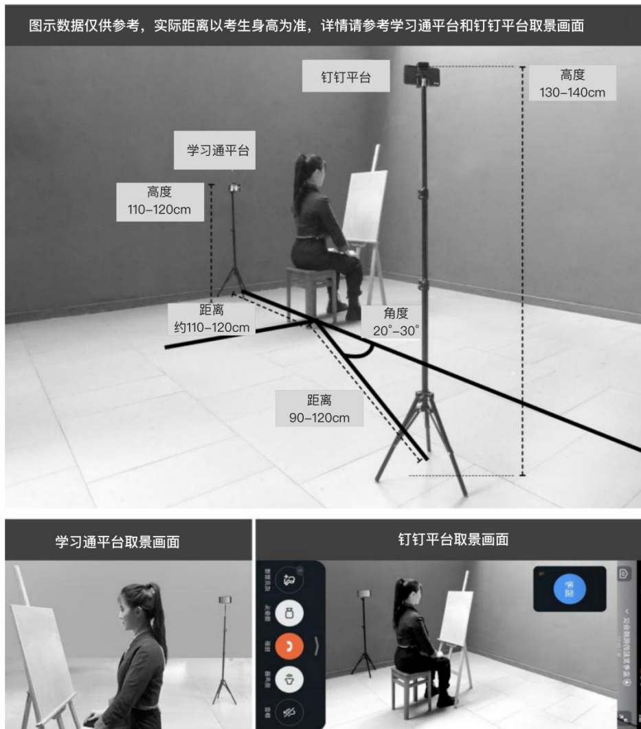
(图 5: 绘画类机考试位图)