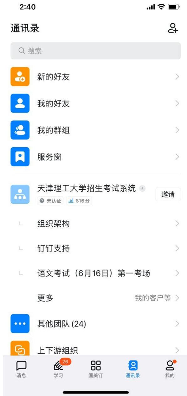
(图 3: “钉钉” 考场信息)