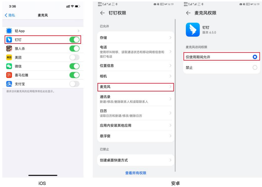
(图 7: 左 iOS/右安卓)