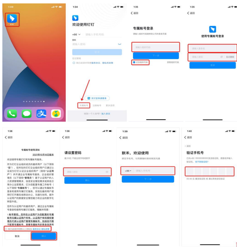
（图2：“钉钉”帐号登录流程）

登录考试平台后，考生可以在页面下方“通讯录”界面看到所属考场信息，如下（图3）所示。