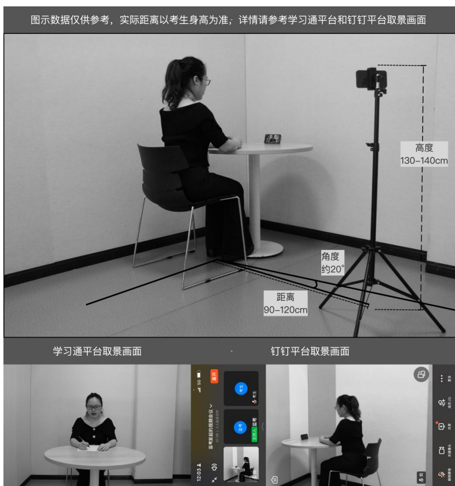
（图4：文化课考试机位图）

视频会议，接入会议后，打开“摄像头”、“扬声器”选项，点击右上角个人画面窗口，使个人画面成为主画面，便于自我检查画面是否符合要求。横屏放置“钉钉”手机，按照对应考试科目如下（图4）或（图5），调整“钉钉”手机距离、角度，使个人画面可以清楚、完整地显示考场环境，画面内容要求包含完整画板、试卷画面、考生本人及作画工具、“超星智慧考试平台”手机及地面环境等内容。如监考员发现监控画面不符合要求，提出调整要求后，按要求整改至符合要求为止，视频接入流程如下（图6）。